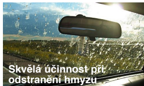
Skvělá účinnost při odstranění hmyzu