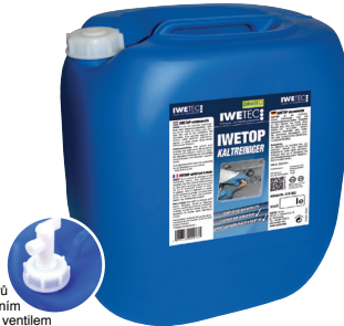
Bal. 30 litrů s výpustním kulovým ventilem

Vysoce účinný čistič a odmašťovač, bez obsahu halogenovaných uhlovodíků